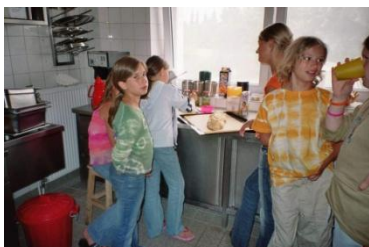
von der Küche des Hauses oder in Eigenregie