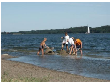
am ruhigen Strand der Schlei