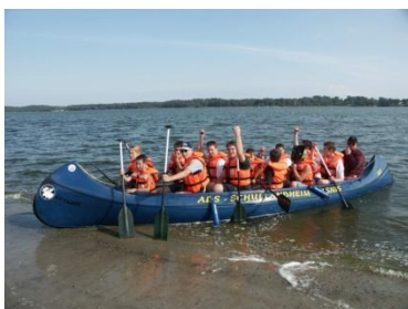
in der Umgebung des Schullandheimes