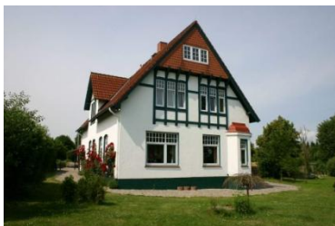
im ADS Schullandheim Ulsnis