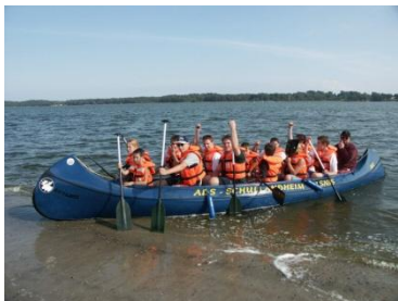
in der Umgebung des Schullandheimes