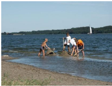
am ruhigen Strand der Schlei