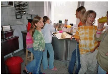
von der Küche des Hauses oder in Eigenregie